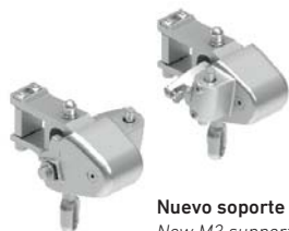
Nuevo soporte M3 New M3 support Nouveau support M3 Nouvo supporto M3