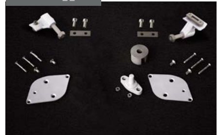
Kit accesorios Front Shadow (sin máquina) Front Shadow accessory kit (without gearbox) Kit accessoires Front Shadow (treuil non inclus) Zubehör-Set Front Shadow (ohne Getriebe einschl.)