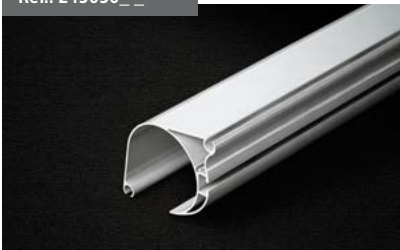
Perfil carga Front Shadow Front Shadow load profile Barre de charge Front Shadow Fallstange Front Shadow