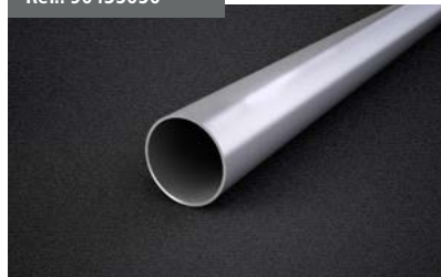
Tubo de enrollle Roller Tube Tube d'enroulement Tuchwalze