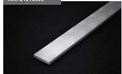
Perfil contrapeso Front Shadow Front Shadow counterweight profile Barre de lestage Front Shadow Gegengeprofil Front Shadow