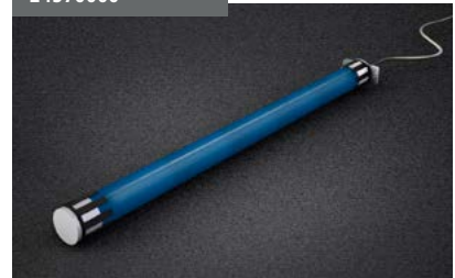
Motor Front Shadow Front Shadow motor